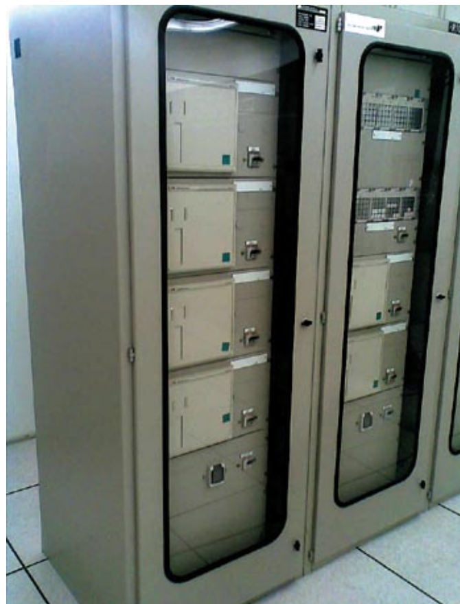
Рис. 2. Современный способ монтажа МУРЗ в релейных шкафах

При этом были бы решены не только очень многие из существующих сегодня проблем, но и была бы существенно снижена стоимость релейной защиты. Последнее позволило бы устанавливать два комплекта идентичных защит вместо одного для по-