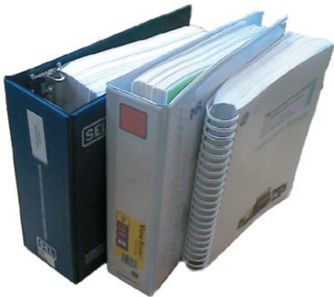
Рис. 4. Многостраничные фолианты с описанием МУРЗ, предназначенные для потребителя

гих таблиц. К этому следует добавить не меньшую гибкость и универсальность испытуемого объекта (МУРЗ), также требующего введения огромного количества параметров из десятков выпадающих меню и таблиц. Малейшее несоответствие между собой настроек МУРЗ и ТСПЗ приводит к неправильным результатам. Причем далеко не всегда можно понять, что полученные результаты неверны.