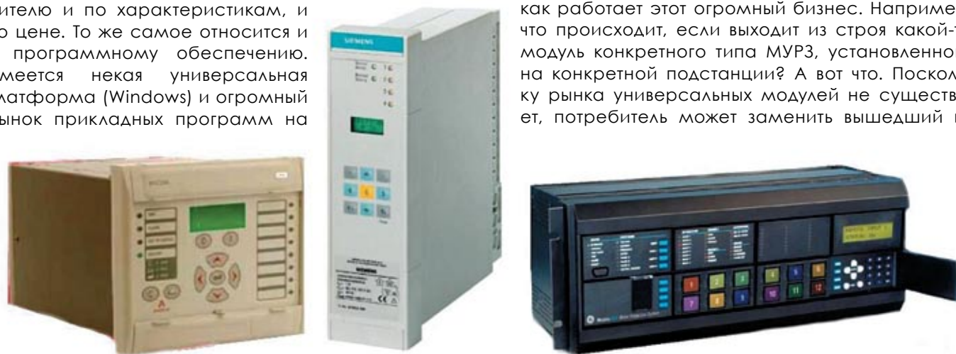
Рис. 1. Внешний вид современных МУРЗ различных производителей

Для ответа на этот вопрос давайте проследим, как работает этот огромный бизнес. Например, что происходит, если выходит из строя какой-то модуль конкретного типа МУРЗ, установленного на конкретной подстанции? А вот что. Поскольку рынка универсальных модулей не существует, потребитель может заменить вышедший из