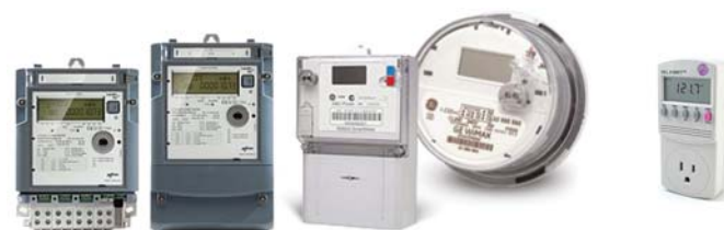
Рисунок 3. «Умные» счетчики электроэнергии